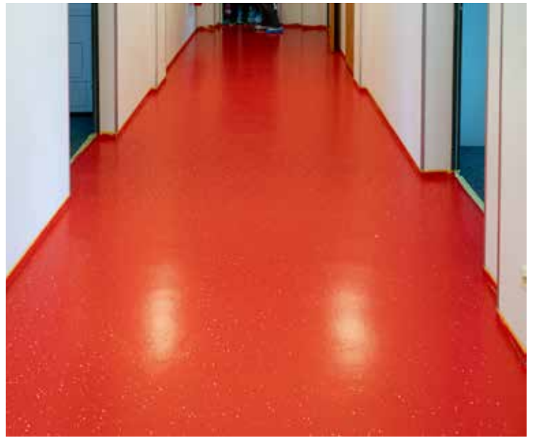
NACH DER RENOVIERUNG